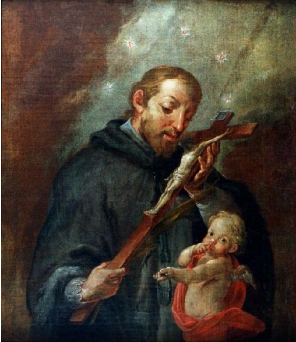
San Juan Nepomuceno [Escuela de Juan de Miranda], s. XVIII ES 35001 MC/PA Pint-0078 - El Museo Canario

Finalizamos este recorrido a través de las adquisiciones aludiendo la representación de San Juan Nepomuceno (Ilust. 4). La pieza, adscrita a la escuela de Juan de Miranda, fue adquirida en 1996 a José Cabrera Falcón. El distintivo de esta figuración lo constituyen tanto su carácter religioso -temática excepcional en este fondo artístico-, como su cronología dieciochesca, etapa representada en El Museo Canario sólo por este valioso lienzo.