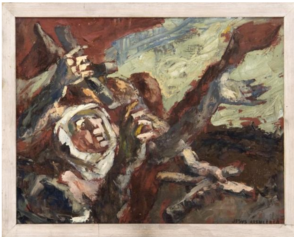
Rogativa de lluvia Jesús González Arencibia ES 35001 MC/PA Pint-0117 - El Museo Canario

La adquisición: vía de ingreso secundaria