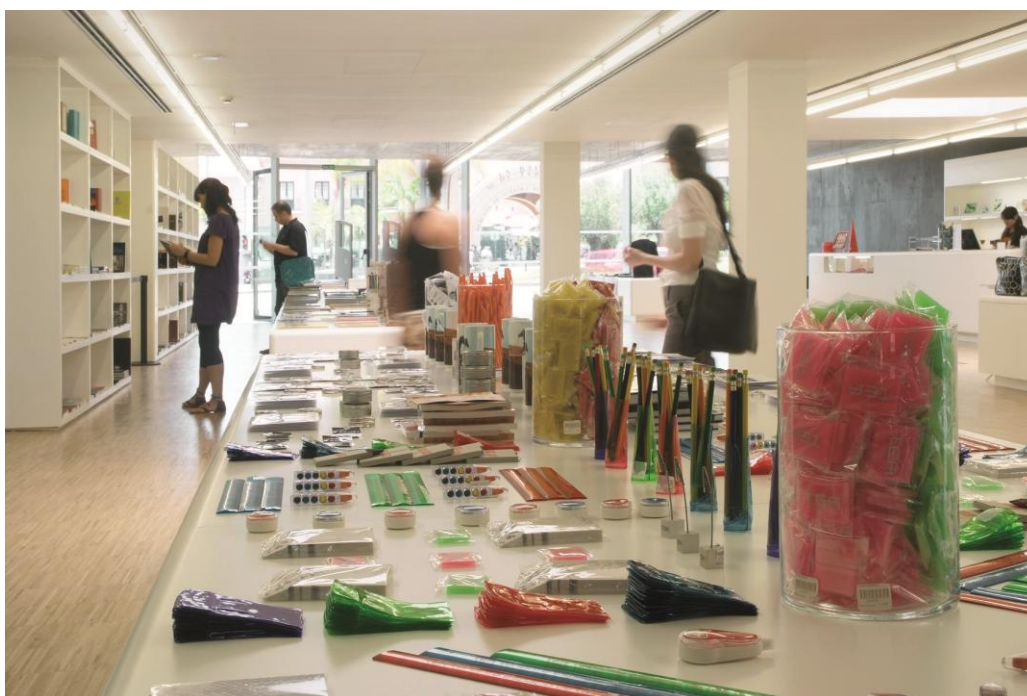
Artículos de la tienda de TEA- Tenerife Espacio de las Artes.