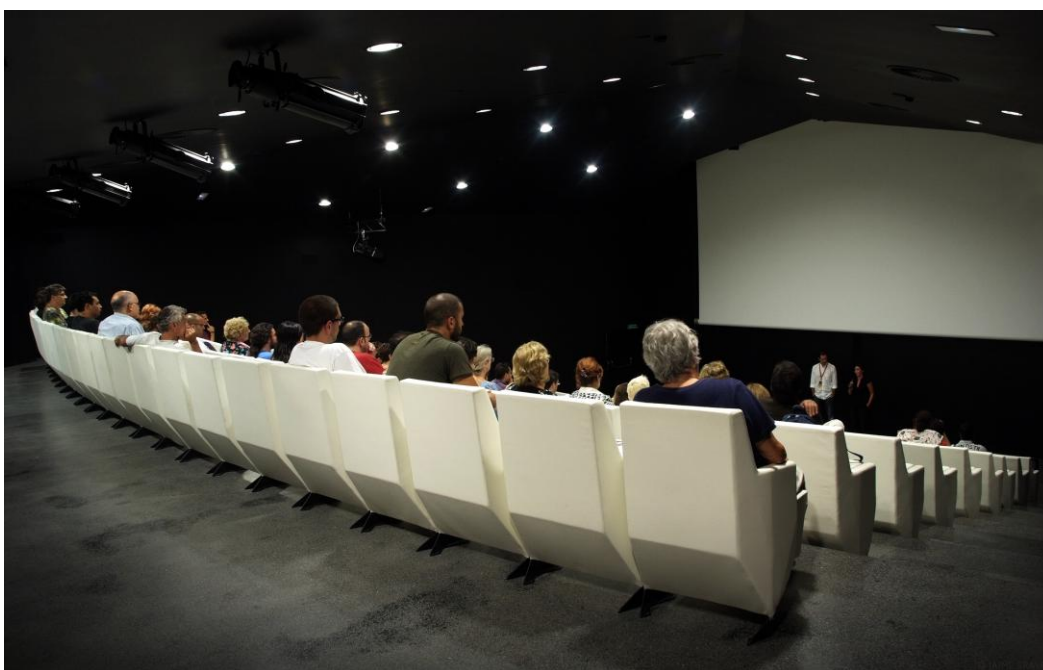
Salón de actos de TEA- Tenerife Espacio de las Artes.