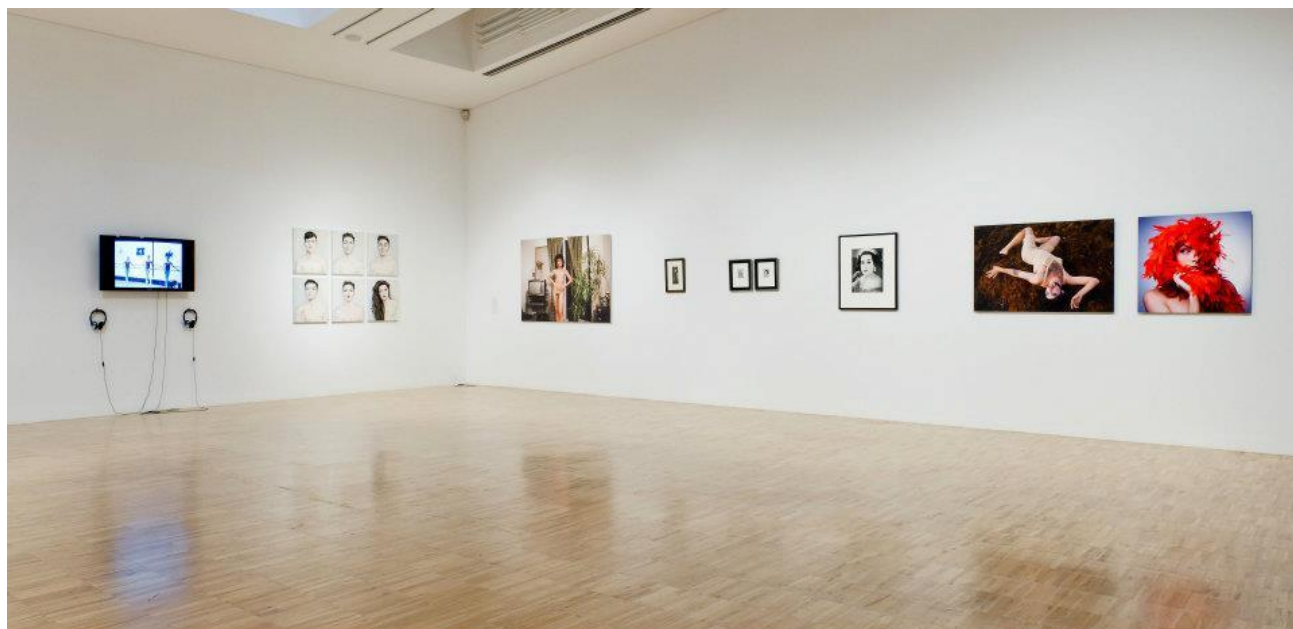
Plano detalle de la salas de exposiciones. Juego de Máscaras. La identidad como ficción.