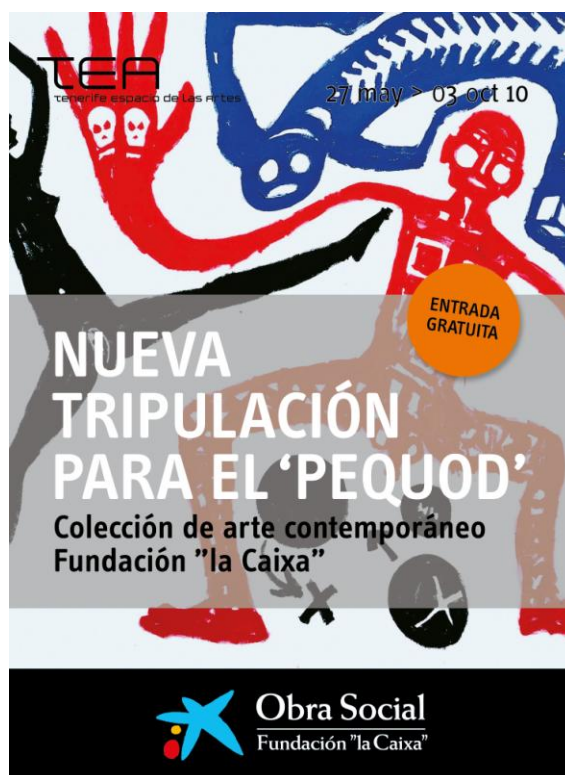
Cartel de la exposición Nueva Tripulación para el Pequod.