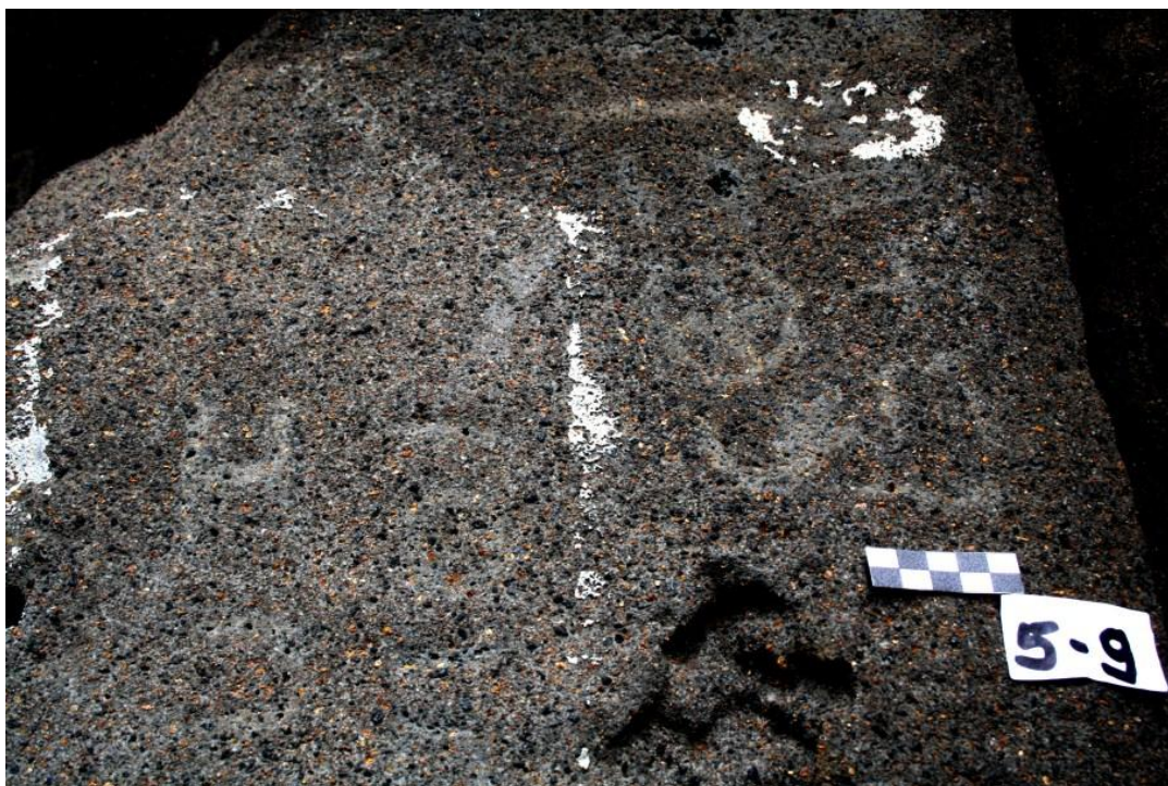
Inscripción líbico-bereber de La Caleta, El Hierro.