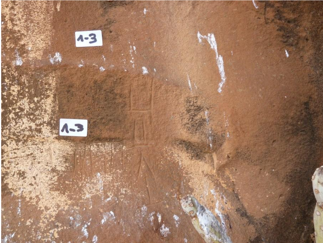
Inscripción líbico-bereber, Barranco del Mojón, Lanzarote.