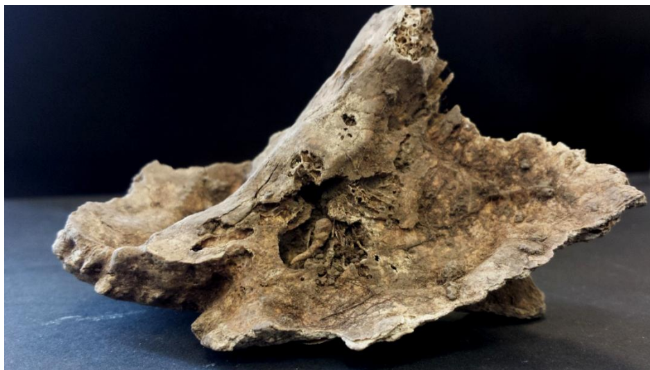
Imagen 5. Martillo derecho.

delicadas 9 , los canales auditivos, colmatados de sedimento, guardaban una sorpresa. Se pudieron recuperar tres de los huesos más pequeños del esqueleto humano: el martillo derecho y el yunque derecho e izquierdo. Los tres diminutos huesos fueron minuciosamente guardados ya que son los únicos ejemplares que conserva el Museo Arqueológico Benahoarita (Imagen 5).