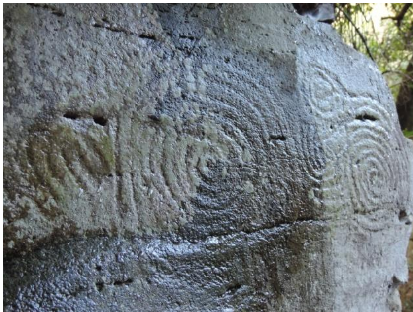
Imagen 3. Posible falo y vulva entre una espiral.

Otra diferencia reseñable y llamativa es la temática, ya que nos encontramos con sendas espirales entre las que se encaja otro motivo muy similar al de La Zarza que, para algunos, podría ser una representación de un falo. Y justo pegado a la otra espiral nos encontramos con unos semicírculos concéntricos con una raya central que podría indicar una vulva (Imagen 3). En La Zarza están enfrentados y ubicados en paneles distintos. Ambos motivos sólo han sido descubiertos, hasta la fecha, en los cabocos de La Zarza y Fuente del Sauce. Debajo de los 4 motivos centrales también aparece una pequeña espiral. Todos ellos fueron ejecutados con la técnica del picado de anchura media y superficial.