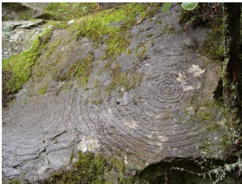
Imagen 2. Círculos concéntricos. Panel 3.

El grupo más importante se ubica en la margen izquierda del caboco, a unos 10 metros por encima del cauce actual del barranco. Se aglutina y rodea completamente a una covacha funeraria que se abre en la base del risco. La estación cuenta, como mínimo, con 7 paneles en los que se representan 11 motivos de círculos concéntricos y unos semicírculos concéntricos. Su estado de conservación es bueno, si bien la superficie de las rocas está profusamente recubierta de musgos y líquenes (Imagen 2).