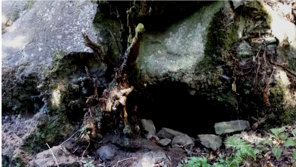
Imagen 4. Boca de la cueva funeraria con círculos concéntricos a su derecha.