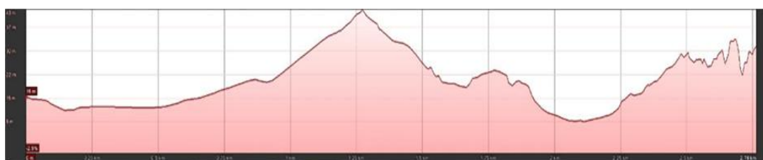
Mapa de la ruta y perfil topográfico [Imagen n.º 3].