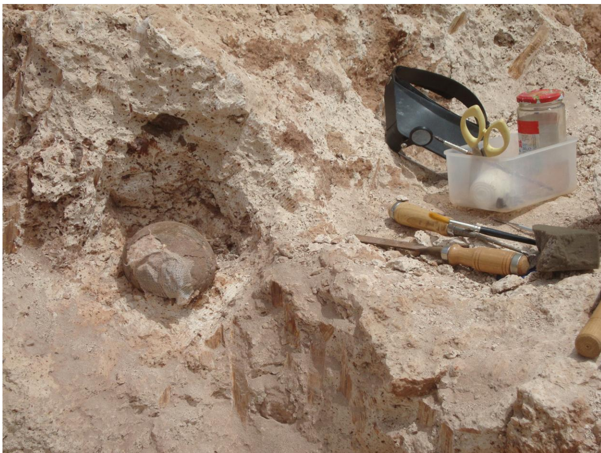
Aporte fotográfico: Yacimiento Valle Grande, Yacimiento Chico, Huevos de Ratites , Cisternas de Los Tablones, Estructura de carácter tumular, Pilonos en la costa, Aljibe tradicional, Salinas de Órzola, Horno de cal de Órzola, Caño de agua y aljibe, Gavias abandonadas, Arenado artificial y Calera de Las Tabaibitas.