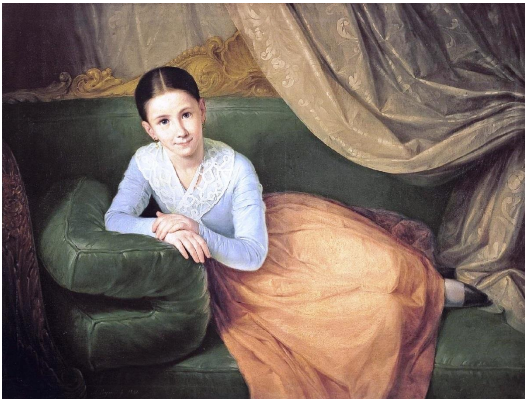
La hija del pintor. Antonio María Esquivel. Museo de Bellas Artes de San Fernando. 1841.