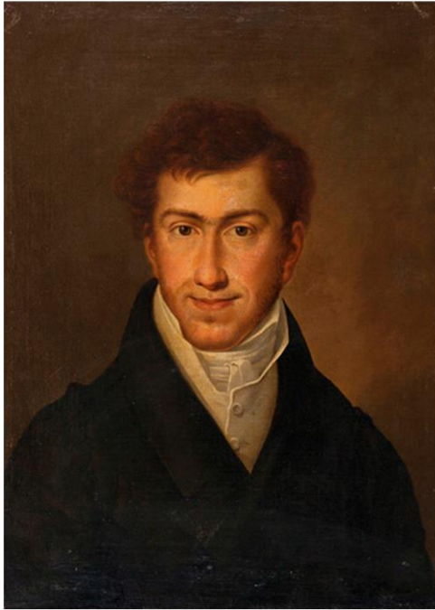
Retrato del Infante Francisco de Paula de Borbón. Colección privada