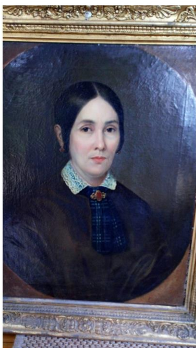
Retrato de señora, firmado y fechado en 1848. Colección privada, Gran Canaria.