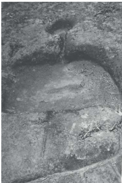
Fig. 4. Estación rupestre en el Barranco de Santos, Santa Cruz de Tenerife, según Luis Diego Cuscoy.

no fueran descubiertos y hallados en el territorio insular de Tenerife; como ejemplo tenemos a Luis Diego Cuscoy (1907-1987), arqueólogo que, como ocurre con la obra de Bethencourt, tras consultar su Fondo Documental es cuando hemos podido comprobar el conocimiento que poseía de estos yacimientos, al mismo tiempo que su desconcierto 25 . En concreto, en su fondo hay una carpeta titulada Marmitas, Queseras, Seroyos 26 , que contiene fotografías, descripciones y manuscritos relacionados con diversos enclaves de Tenerife donde están presentes cazoletas y canales, a los que denomina 'seroyos'. Los sitúa en Tejina, Tegueste, Santa Cruz (Fig. 4), Anaga, etc., destacando en sus escritos la diversidad de los emplazamientos que describe, la ubicación tanto al interior como al exterior de cuevas, y las características técnicas y las dimensiones de los mismos. Igualmente, deja constancia de sus dudas con respecto a su posible adscripción a la cultura guanche; permanece en él la incertidumbre porque, al igual que en el pasado, desde un punto de vista metodológico no encuentra los paralelos culturales con los que poder adoptar una hipótesis fiable, pareciendo además desconocer la interpretación dada por los historiadores grancanarios del siglo XIX 27 .