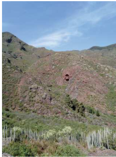
Fig. 3. Probable ubicación de la Cueva Santa en el Barranco de Tahodio. Anaga (Santa Cruz de Tenerife). Autor: B. Gallego.

Montaña de Arguama 23 . Hacia el Este, ya en el Rosario, en la zona de Machado, Jénica, donde ubica una fuente en la que era tradición bautizar. En esta zona hay varias estaciones rupestres de cazoletas y canales de singulares definiciones y acabados. En Santa Cruz de Tenerife, tanto el barranco de Santos, como el de Tahodio, ya en Anaga, son mencionados como los lugares donde residen la Cueva de los Santos en el primero, y en el segundo, la Cueva Santa, en Valle de Vega, zona alta de Tahodio (Fig. 3). En ambos barrancos son varias las estaciones rupestres de cazoletas y canales, algunas muy complejas. Hay más ejemplos por la geografía insular, en el sur, Jama, Chasna, etc., donde recoge lugares vinculados con prácticas religiosas y donde también hallamos emplazamientos con yacimientos rupestres de este tipo. En todos los casos, los yacimientos de cazoletas y canales pueden presentar singularidades de motivos rupestres, morfologías, naturalezas, contextos, etc. que sirven para clasificar y valorar la información dada por el historiador a dicho enclave.