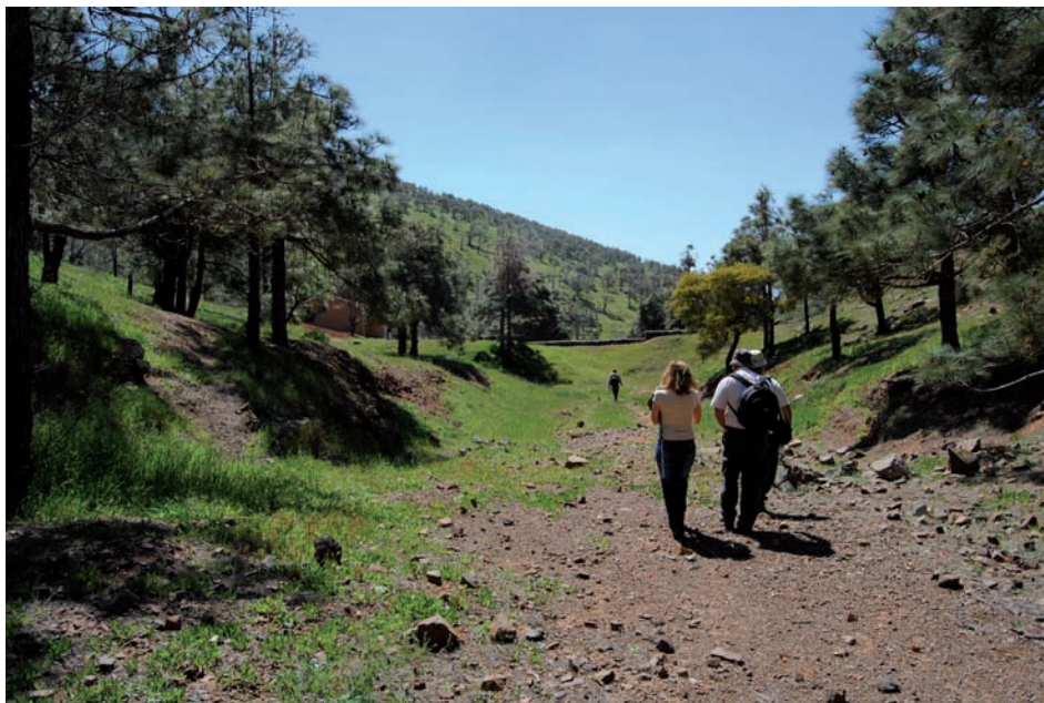
Fig.4: PINAR DE BETANCURIA EN INVIERNO