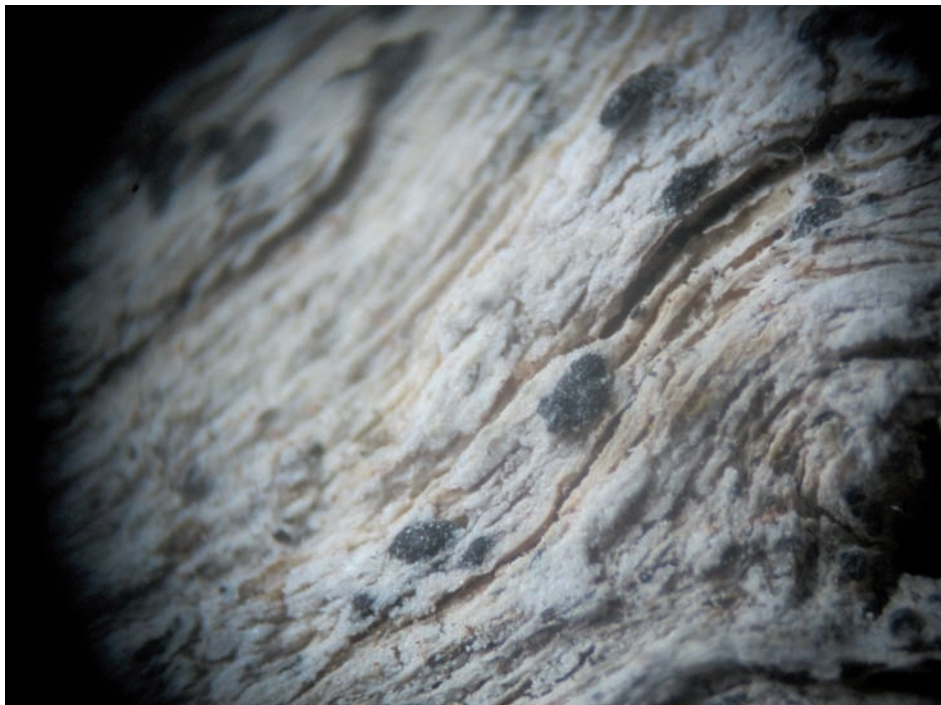
Fig.2: LOPHIOSTOMA COMPRESSUM