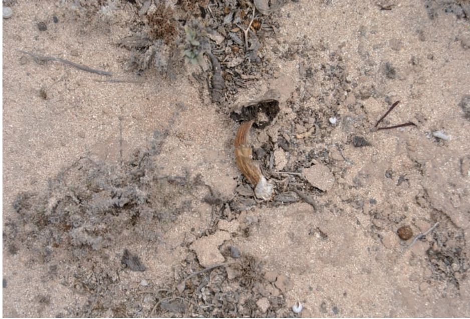
Fig.5: AGARICUS ARIDICOLA