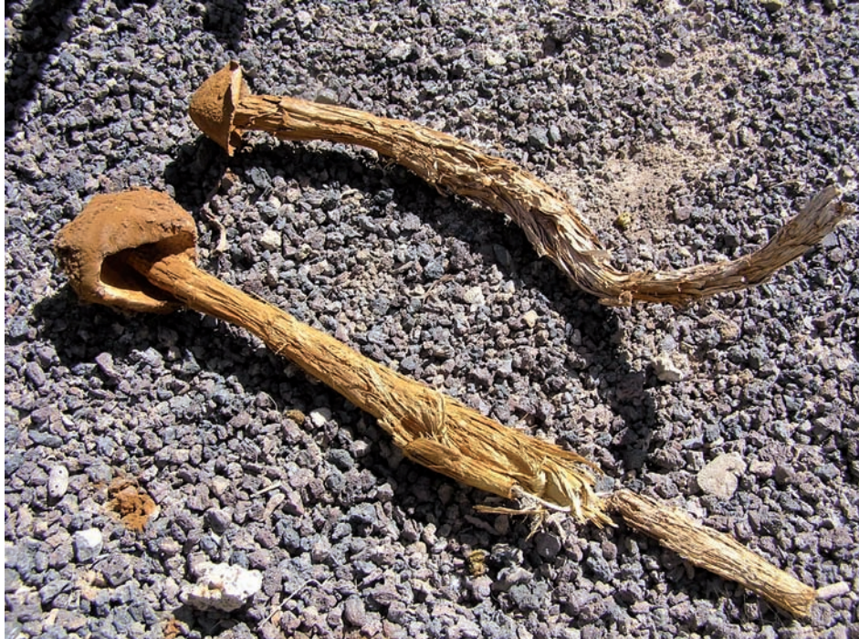
Fig.3: BATTARREA STEVENII