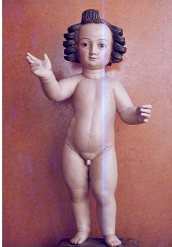
Niño Jesús bendicente. Iglesia de San Antonio de Granadilla.