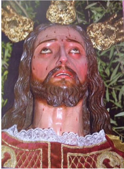
Cabeza del Cristo , Paso de la Oración en el Huerto. Iglesia de San Francisco, Garachico. Foto del