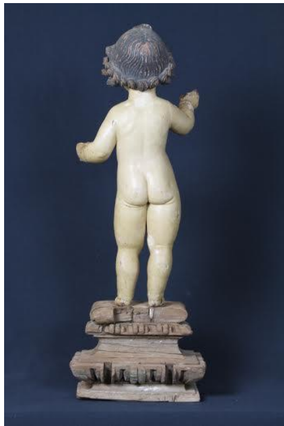
Niño Jesús bendicente. (det). Iglesia de San Antonio de Granadilla.