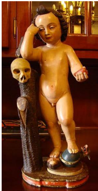
Niño Jesús triunfador sobre el mundo, el demonio y la carne. Iglesia de Santa Úrsula, Santa Úrsula.