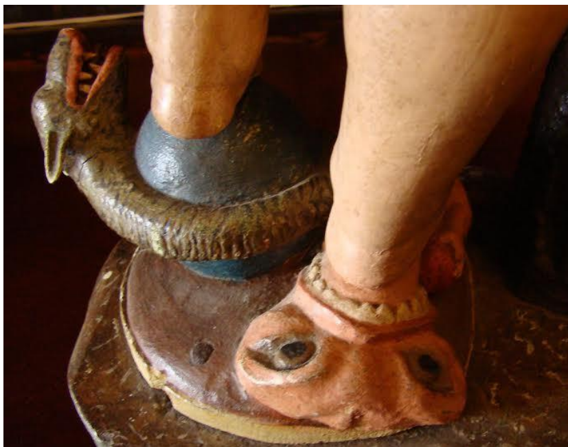
Vagina dentata . Detalle del Niño Jesús de la Iglesia de Santa Úrsula.

Por otro lado y si observamos la figura de cintura hacia arriba, pareciera una balanza de modo que a la derecha se sitúa el atributo parlante de la calavera, en cuya parte superior se apoya el codo, mientras que la mano izquierda tiene un corazón. El corazón se identifica con la caridad, de modo que Jesús presiente el martirio de la cruz que le espera, consumando así su oblación y misión redentora. De cintura hacia abajo aparecen los vicios y tentaciones: el mundo, el demonio y la carne. El pie izquierdo se apoya sobre el globo terráqueo rodeado por el demonio con apariencia híbrida: cuerpo de serpiente y cabeza de dragón; el antepie derecho pisa a Eva la inductora al pecado, y por tanto cómplice de la desdicha universal, mientras que el talón aplasta una vagina dentada, figurada en una gran boca abierta de afilados dientes y