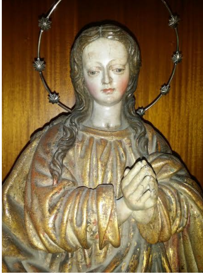
Inmaculada Concepción . Iglesia de Santa Úrsula, Santa Úrsula. Pág. 14.