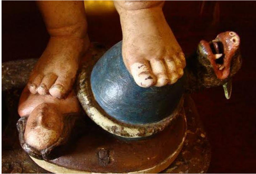
Niño Jesús triunfador sobre el mundo, el demonio y la carne (det). Iglesia de Santa Úrsula.