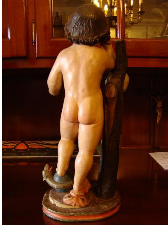
Niño Jesús triunfador sobre el mundo, el demonio y la carne (det). Iglesia de Santa Úrsula.

La escultura supuestamente fue robada de su templo, apareciendo hace un par de años en la Facultad de BB.AA. de la Universidad de La Laguna, en el departamento de restauración, a donde al parecer llegó llevada por un particular que la había comprado, habiendo sufrido serias mutilaciones en cabeza, manos y piernas.