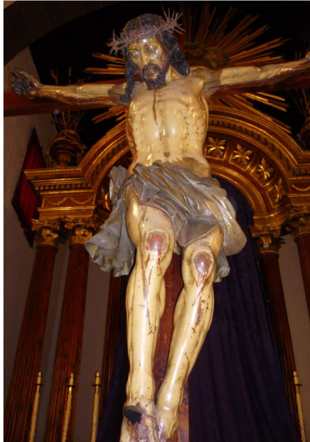
Crucificado . Martín de Andújar Cantos. Iglesia de Santa Ana, Garachico.