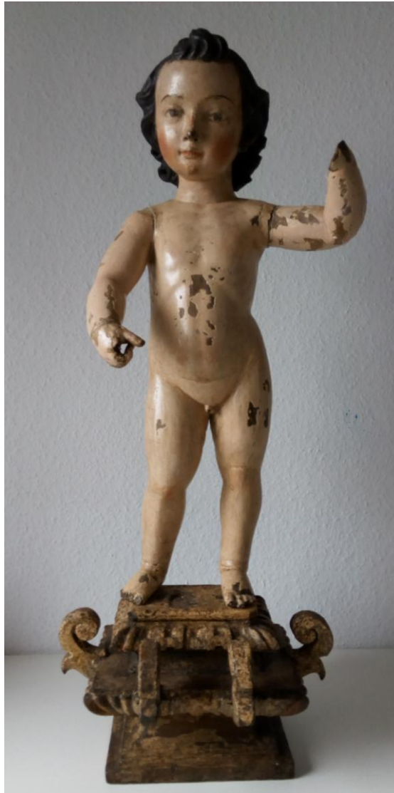
San Juanito . Colección particular, Tenerife.

de gruesos muslos nos recuerdan a los de los crucificados tallados por Francisco Alonso en 1644 y 1670, respectivamente. No hay muchos datos sobre ella, aunque sabemos que ha pertenecido a varias generaciones de la misma familia desde el siglo XVIII. Se desconoce su procedencia, aunque debido al mal estado en el que se encontraba y a los muchos repintes que presentaba, pudo tratarse de alguna pieza retirada de algún convento, incluso que hubiera sufrido algún incendio, pues en su restauración se observaron síntomas de ello. Desde muy antiguo se le hacía fiesta, colocándose en el camino que conducía al Puerto de la Cruz desde la zona alta del valle de La Orotava 30 . Por las coincidencias estilísticas, no dudamos en adscribirlo a la gubia del gomero Francisco A. de la Raya, debiendo haberlo ejecutado en la década de los años 50 del siglo XVII.