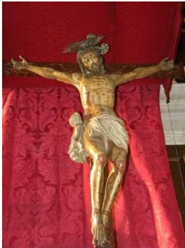
Cristo de las Aguas . Francisco A. de la Raya (1644). Iglesia de San Francisco, Icod.

-particularmente el rostro- como el cuerpo repiten los esquemas del Crucificado del Calvario de La Laguna, esculpido por Francisco Alonso de la Raya en 1670. No obstante, en este caso nos hallamos ante una figura bastante más dura en su tratamiento y rígida en sus articulaciones, cuyo rostro parece querer imitar el del cristo antes mencionado, por lo que nos inclinamos a pensar que pudo haber salido de la gubia de alguno de sus discípulos, quizás de la de su hijo Salvador Alonso de Figueroa (1662-1700) 13 .