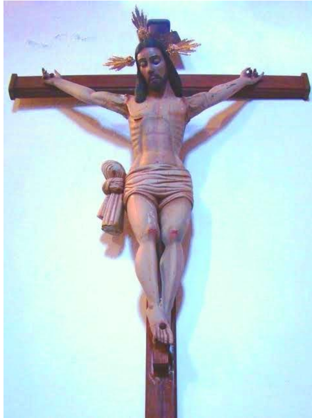
Cristo de la Salud. Iglesia de El Salvador, Alajeró.