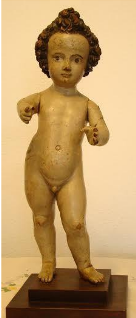
Niño Jesús. Colección particular, Tenerife.