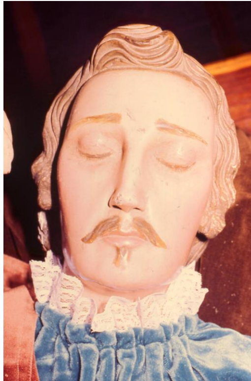
Cabeza de San Juan , Paso de la Oración en el Huerto. Iglesia de San Francisco, Garachico.

Otras imágenes pasionistas, siguen las mismas pautas caso del Cristo maniatado de la iglesia de la Concepción de La Orotava, cuyas repetitivas fórmulas se aprecian especialmente en la talla de cabellos, barba y bigote.